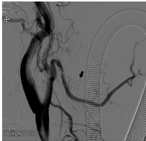
Figura 3. Arteriografía de control tras embolización selectiva de la lesión mediante coils (flecha) en la que se objetiva el cierre completo del pseudoaneurisma, con permeabilidad de la arteria facial.