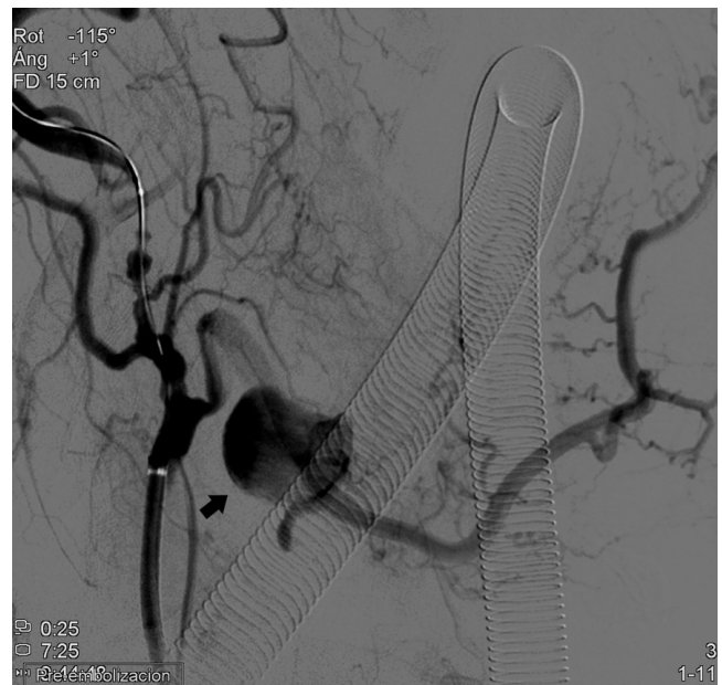
Figura 2. Arteriografía que confirmó la presencia de una dilatación sacular (flecha) compatible con pseudoaneurisma en región submandibular izquierda, dependiente de la rama palatina ascendente de la arteria facial.

Los pseudoaneurismas de la ACE y sus ramas son lesiones poco frecuentes, normalmente asociadas a fenómenos mecánicos. El trabajo de Nadig y cols. (2009) ilustra el carácter poco usual de estas, donde se reportaron nueve casos en veinticinco años 3 . En este territorio, se han descrito pseudoaneurismas de las arterias temporal superficial, maxilar interna, lingual y facial, siendo la arteria temporal superficial la de mayor incidencia 12 . A nivel de la arteria facial los pseudoaneurismas son raros, debido a su pequeño calibre, y la mayor parte de los casos descritos son debidos a traumatismos directos o cirugía mandibular 13 . A este respecto, merecen mención los casos secundarios a exodoncias (Marco de Lucas, 2007; Pukenas 2012; Meena, 2022). La infección como causa directa de estas lesiones a dicho nivel es aún más rara, estando la mayor parte de los casos descritos en la literatura asociados a amigdalitis (Tabla I). Lopes Oliveira y cols. describen en 2015 dos casos de pseudoaneurisma de la arteria facial secundarios a infecciones odontógenas 14 . En nuestro caso, la ausencia de un antecedente traumático junto con los hallazgos clínico-radiológicos (colec-