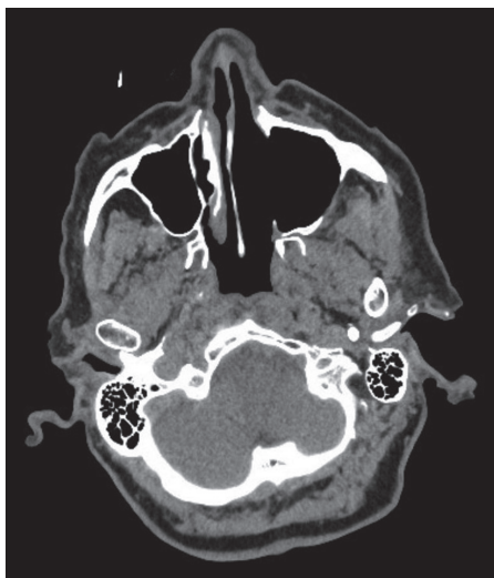
Figura 3. Cortes coronales y axiales del TC de control.