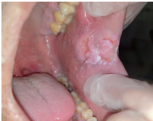
Figura 1. Lesión inicial del paciente en mucosa yugal izquierda.

Dados los hallazgos, se solicitó un cultivo de esputo y baciloscopia, detectándose bacilos ácido-alcohol resistentes. El paciente fue diagnosticado de tuberculosis pulmonar primaria con afectación cervical y yugal izquierdas. Se decidió derivar a medicina interna para establecer tratamiento antibiótico y seguimiento conjunto. Tras estudio de resistencias, se comenzó tratamiento con isoniacida, rifampicina, pirazinamida y etambutol. En la revisión de los 3 meses, se objetiva notoria mejoría