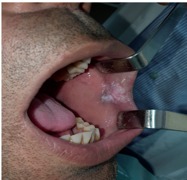
Figura 4. Lesión a nivel de mucosa yugal izquierda a los 3 meses del inicio del tratamiento.

de la lesión tras comenzar con el tratamiento antibiótico (Figura 4).