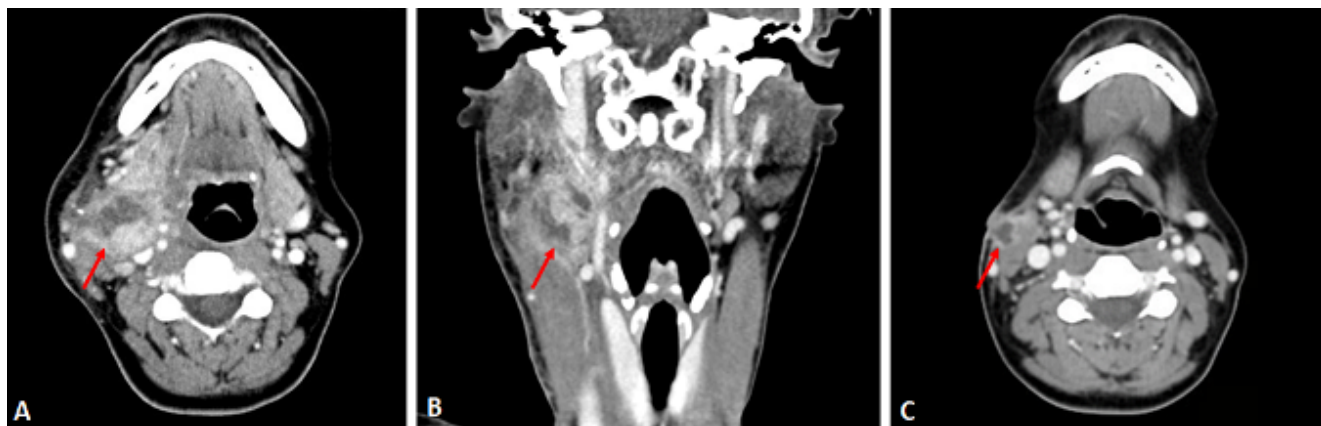
Figura 1. A y B: TAC inicial. Lesión nodular con cambios necróticos en su interior, sugestiva de colección/conglomerado adenopático abscesificado, sin poder descartar masa de origen neoplásico. C: TAC postquirúrgico; cambios postquirúrgicos con pequeño absceso postquirúrgico en el trayecto de abordaje.

das volvieron a confirmar el diagnóstico de linfadenitis supurativa por Staphylococcus aureus sensible a cloxacilina (Figura 2). Sin embargo, no se encontró en el área otorrinolaringológica ningún foco que justificara la linfadenitis.