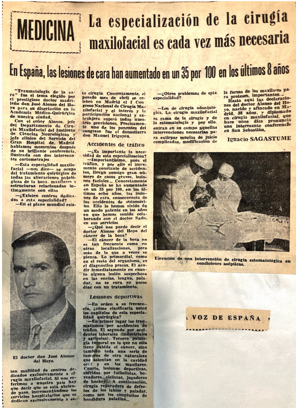
Figura 2. Recorte de prensa de La Voz de España , destacando los avances pioneros de la cirugía maxilofacial en España, de la mano de José Alonso del Hoyo y otros, cuando la especialidad daba sus primeros pasos.