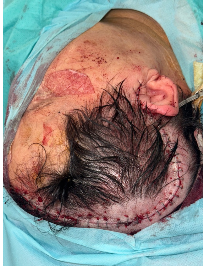
Figura 4. Imagen postoperatoria inmediata. Cierre de abordaje hemicoronal derecho.

presentarse en localizaciones como la órbita, el cuero cabelludo, la cavidad nasal, los senos paranasales, el oído medio, el cuello, la piel, la mandíbula, el maxilar e incluso huesos periféricos como el pelvis 1-5 . Hasta el día de hoy no se han reportado casos en la literatura en el músculo temporal.