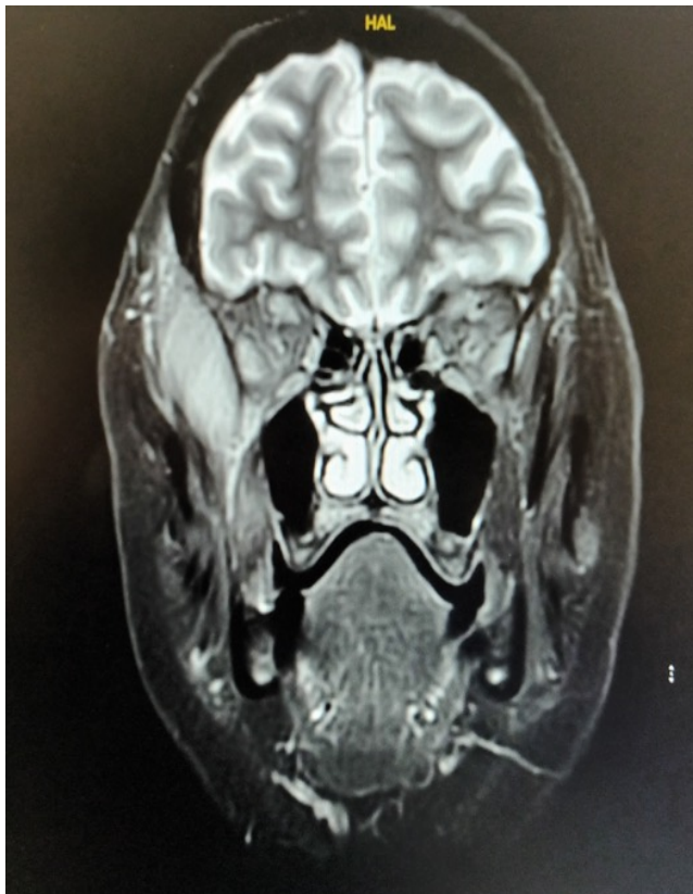
Figura 1. RMN craneal, plano coronal. Masa en músculo temporal derecho, ovalada (2 cm anteroposterior x 2 cm lateral x 4 cm craneocaudal), bien delimitada.

Se presenta el caso de una paciente de 66 años, sin antecedentes de interés, que acude a la consulta por un aumento de partes blandas en la región temporal derecha. Refería ciertas disestesias y aumento de volumen progresivo en dicha región. Se realizó estudio con TC y RMN, donde se describe una lesión ovalada (2 cm anteroposterior x 2 cm lateral x 4 cm craneocaudal), bien delimitada, inmersa en músculo temporal, desde fosa temporal derecha hasta arco cigomático