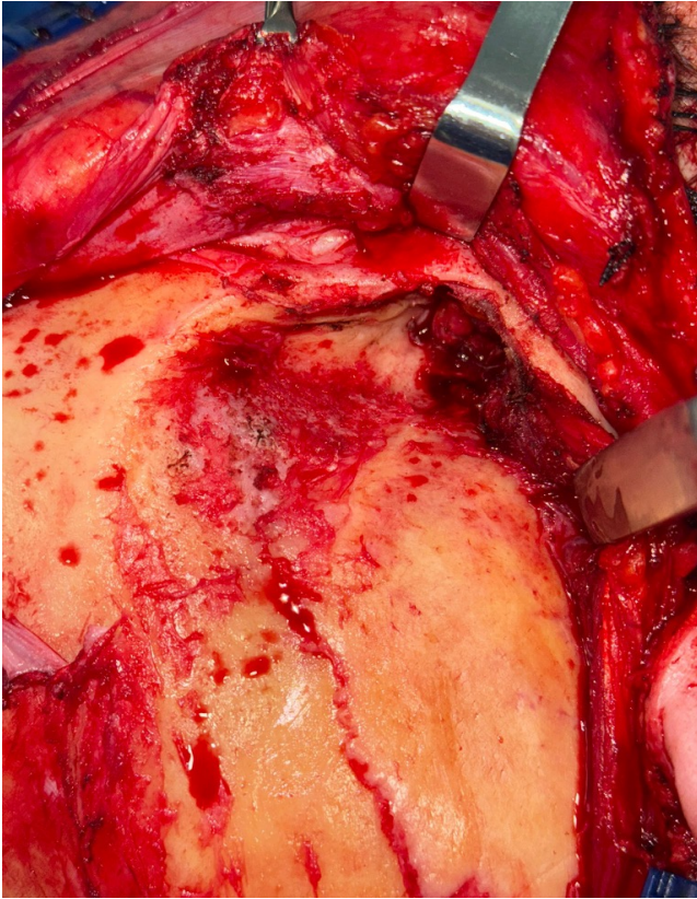
Figura 3. Lecho quirúrgico tras resección de masa y músculo temporal derecho en margen profundo, sin evidencia de lesión ósea.