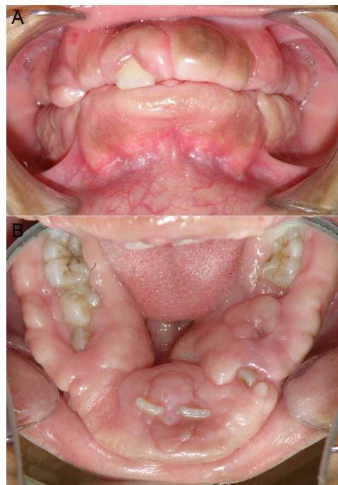
Figura 1 – (A y B) Aumento en el volumen de la encía de forma generalizada, con apariencia fibromatosa, consistencia firme y se encontró cubriendo la corona de los dientes.

A continuación se reporta el caso clínico de un paciente pediátrico que presentó características clínicas