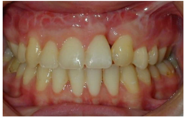
Figura 8 – Paciente n.º 3: resalte y sobremordida mantenida 8 años después de la DO.

Es posible que la contracción de la herida juegue un papel importante en la recidiva. También hay que tener en cuenta el impacto de la oclusión final en la misma; se ha visto más recaída en pacientes que terminaron con una mordida abierta anterior. La obtención de sobremordida y resalte es la llave de la estabilidad oclusal (fig. 8) y de la disminución de la cantidad de recaída.