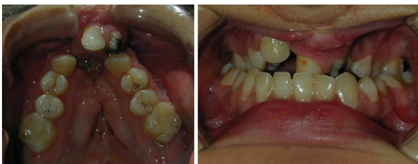
Figura 2 – Paciente n.º 1: intra oral fisura labio palatina bilateral completa.

Angle (fig. 1). También presentaban en algunos casos colapso transversal del arco alveolar, anomalías dentales, cicatrices y fibrosis en paladar por cirugías anteriores (fig. 2). En todos se realizó el avance del maxilar superior mediante distracción osteogénica con distractores internos, excepto en un caso en que el distractor interno no fue suficiente para avanzar el maxilar los milímetros deseados lo que obligó a utilizar un distractor externo rígido. Todos los pacientes fueron preparados ortodóncicamente para la realización de la distracción, expandiendo el maxilar, nivelando curvas, alineando los dientes y descompensándolos según requería cada caso (fig. 3). Bajo anestesia general se les realizó una osteotomía tipo Le Fort I, con disyunción pterigomaxilar y septal, movilización total del maxilar sin «down-fracture» e inserción del distractor. En todos los pacientes se realizó un modelo estereolitográfico, donde se planificó la cirugía, se modelaron los distractores con el vector de distracción deseado, y se confeccionó una plantilla para así hacer una transferencia lo más exacta posible del plan operatorio sobre el modelo estereolitográfico al paciente en quirófano, aportando precisión en la colocación de los distractores y disminuyendo el tiempo quirúrgico.