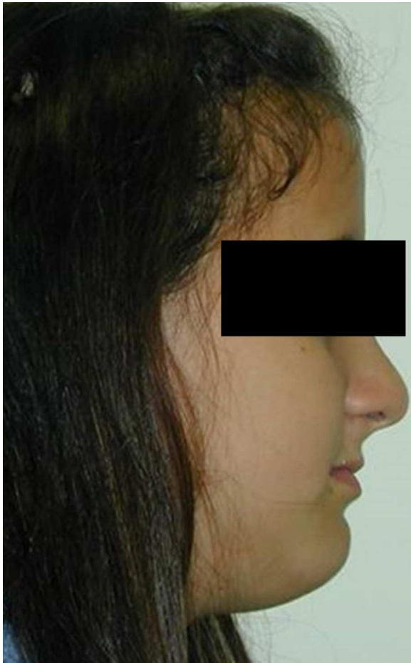
Figura 4 – Paciente n.º 4: fisura palatina con hipoplasia maxilar asociada pre-distracción.

del dispositivo interno se le colocó el sistema RED con el que se consiguió un avance del punto A de 16 mm obteniéndose unas relaciones maxilomandibulares correctas.