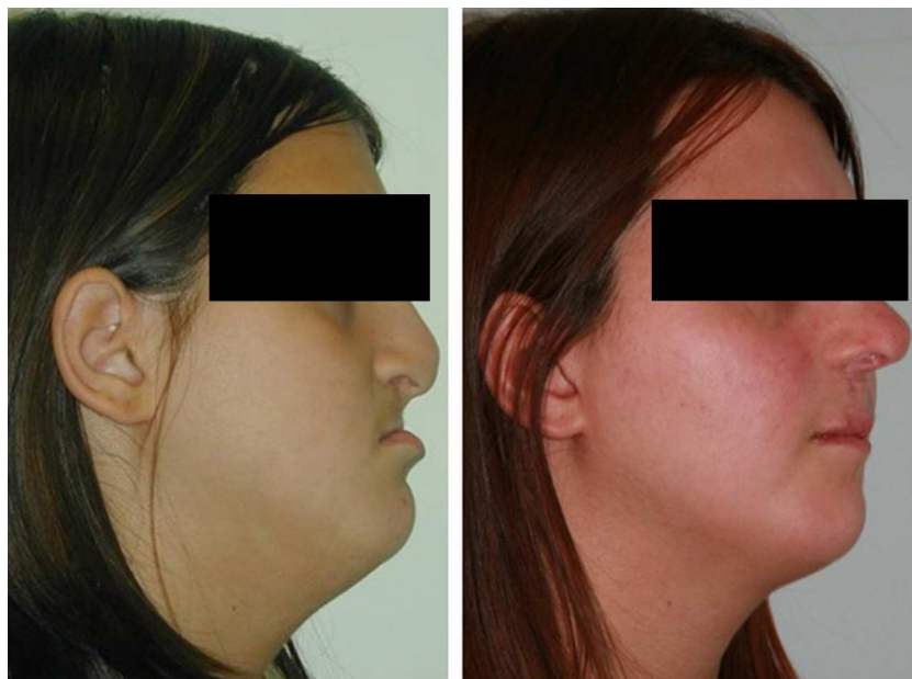
Figura 9 – Paciente n.º 1: fisura labio palatina bilateral completa. Izquierda: tras fracaso de DO intraoral. Derecha: tras 3 años de seguimiento posdistracción mediante RED.

El sistema RED tiene menos limitaciones en relación con la cantidad y la dirección del avance del maxilar; sin embargo el paciente tiene que usar un dispositivo relativamente grande, que se fija en la zona temporal lateral por un período de tiempo largo, incluyendo el tiempo de consolidación y puede llegar a ser una causa grave de complicaciones postoperatorias causadas por el estrés psicológico y el riesgo potencial de lesión accidental en la cabeza.