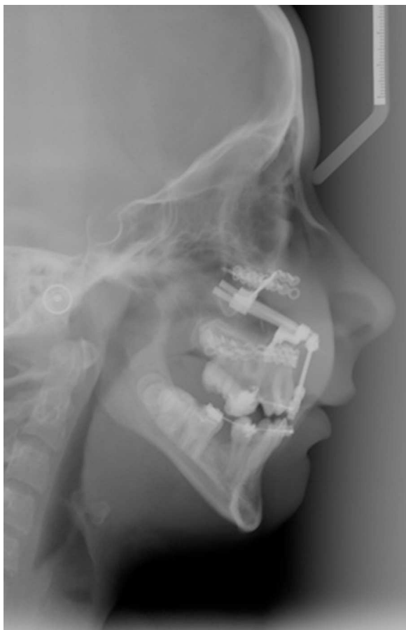
Figura 6 – Paciente n.º 4: distractor transinusoidal en fase de contención.

la razón de la rotación del maxilar durante la distracción e incluso la detención durante la misma, como ocurrió en uno de los pacientes con cicatrices muy fibrosas en paladar y labio, cuya distracción interna fracasó. Uno de los casos lo reconducimos mediante distracción externa con RED, obteniendo el avance deseado.