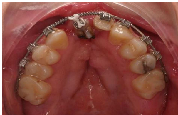
Figura 3 – Paciente n.º 1: preparación ortodóncica tras alveoplastia secundaria bilateral.

El vector de distracción fue paralelo al plano oclusal. El periodo de latencia fue de 5 días, el ritmo de distracción 0,5mm cada 12 horas y la sobrecorrección fue de 2-4mms según los casos. El tiempo de contención en los pacientes con distractores internos fue de más de 5 meses y en el caso