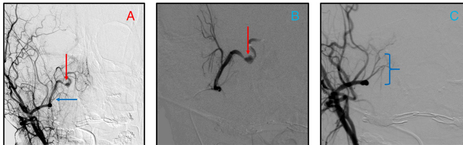
Figura 2 – Arteriografía durante la embolización del pseudoaneurisma. A) Visión antero-posterior de la arteria carótida externa derecha y de sus ramas terminales (flecha horizontal mostrando la porción proximal de la arteria maxilar interna) y pseudoaneurisma (flecha vertical). Arteriografía selectiva de la arteria maxilar interna mostrando pseudoaneurisma (flecha vertical) antes (B) y después (C) de embolización con lipiodol y cianoacrilato en una concentración del 50%. La lesión no es visible en la última imagen, la cual mostraba la porción distal de la arteria maxilar interna (corchete).

clínica asociada a lesión de la arteria maxilar interna suele ser epistaxis y molestias faciales inespecíficas aunque se ha reportado la presencia de soplo y efecto de masa por la lesión 5 .