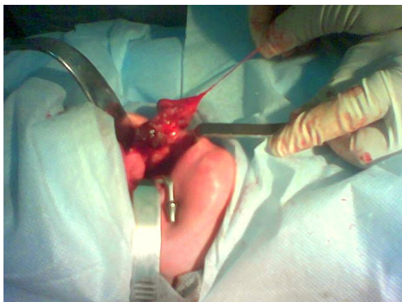
Figura 1 – Tejido parotídeo de características normales.

Tras incidir en la mucosa se halló un tumor laxo, color rojo vinoso, de aspecto vascular, que se extirpó sin dificultad por la misma incisión, comprobándose su continuidad con el tejido parotídeo de características normales (fig. 1). La biopsia por congelación informó una lesión compatible con un tumor vascular benigno. Se cerró la mucosa con puntos separados de ácido poliglicólico y se dio por finalizado el procedimiento. La evolución fue favorable con alta hospitalaria a las 24 h y recuperación completa de la parálisis facial a los 10 d del postoperatorio. No presenta evidencias de enfermedad tras 5 años de seguimiento. El informe histológico diferido fue hemangioma capilar de la parótida. (fig. 2).