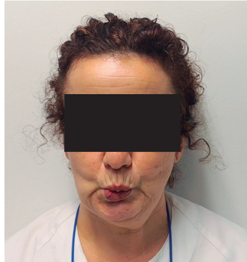
Figura 3. Situación clínica de la paciente a los 8 meses del inicio del cuadro, evidenciándose una recuperación casi completa de la parálisis de la rama marginal izquierda.