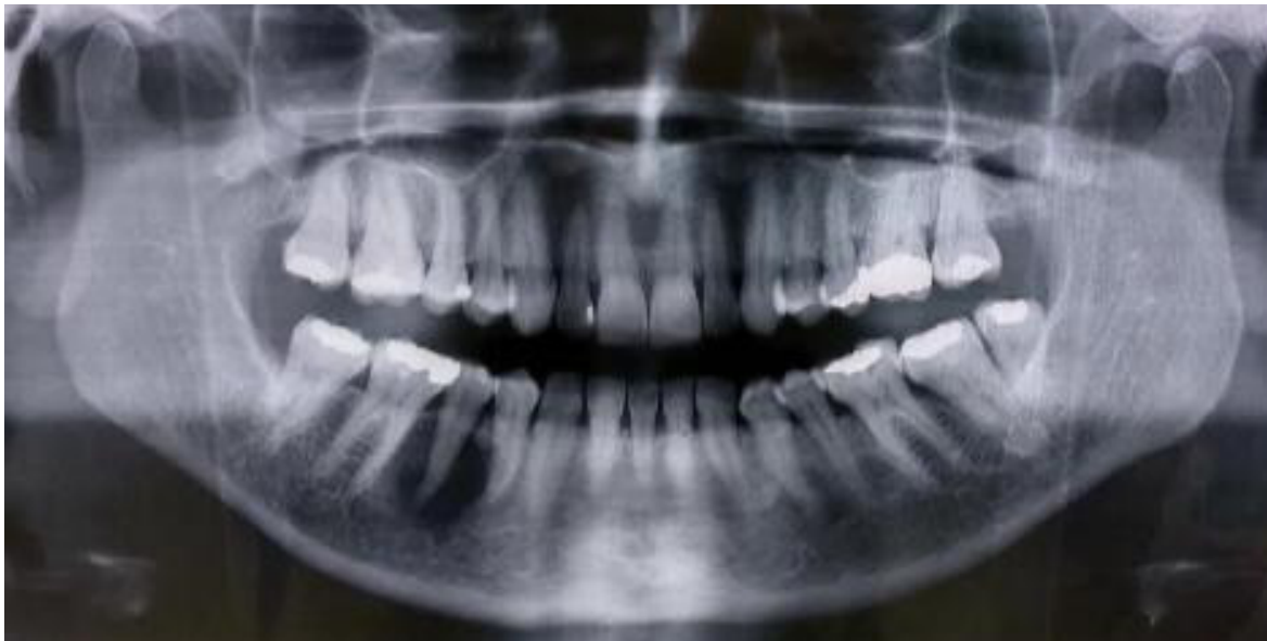
Figura 2. Lesión única osteolítica y con bordes pobremente definidos. Diente 45.