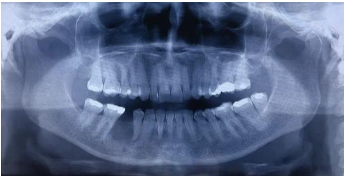
Figura 4. Radiografía panorámica. Seguimiento a cinco meses. Ausencia de cambios aparentes en el patrón óseo que indiquen recidiva.