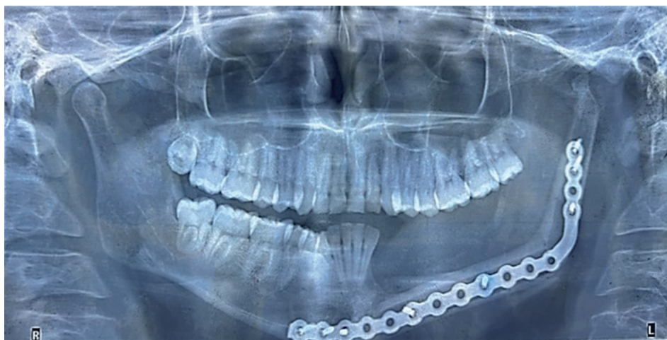
Figura 3. Radiografía panorámica realizada 1 año después de la intervención quirúrgica.