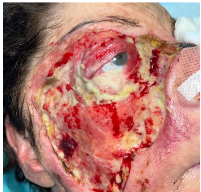
Figura 2. Estado de la enfermedad y afectación ocular tres días tras primera cirugía.