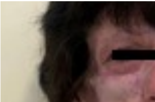
Figura 4. Aspecto actual de la paciente con la epítisis colocada sobre los implantes.

Se planificó en un segundo tiempo, y tras control completo de la infección, la reconstrucción diferida del defecto orbitofacial, con la colocación de tres implantes orbitarios osteointegrados, de un tamaño de 6 \times 4 milímetros. Dos de ellos fueron colocados en el reborde supraorbitario del ojo derecho y el tercero en la pared lateral. Fueron planificados virtualmente y se diseñó una guía quirúrgica personalizada, lo que permitió una colocación precisa de los implantes en hueso orbitario remanente viable, con el objetivo de permitir más adelante la rehabilitación protésica con una epítisis. Además, fueron recubiertos con un injerto libre de espesor total de piel obtenido del muslo izquierdo de la paciente (Figura 3).