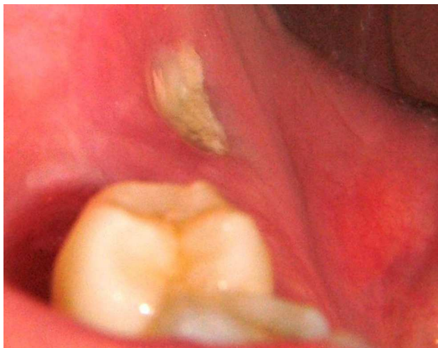
Figura 3 – Necrosis ósea espontánea zona retromolar sector 4.