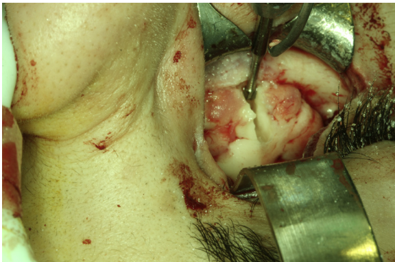
Figura 2 – Imagen intraoperatoria donde se observa el fragmento de osteoma que penetra en la cavidad orbitaria.

en la TAC se muestra como un tejido hiperdenso, homogéneo y de márgenes bien definidos sin captación de contraste 5 . El diagnóstico diferencial debe realizarse fundamentalmente con el osteosarcoma.