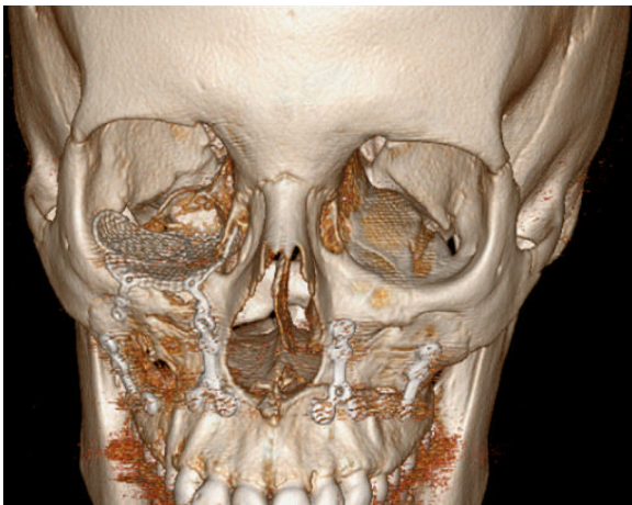
Figura 3 – Imagen de la TC donde se aprecia la correcta reconstrucción de la órbita derecha.

en la TAC se muestra como un tejido hiperdenso, homogéneo y de márgenes bien definidos sin captación de contraste 5 . El diagnóstico diferencial debe realizarse fundamentalmente con el osteosarcoma.